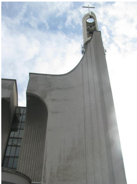
Zaf. nr 1: Widok ogólny instalacji radiokomunikacyjnej.